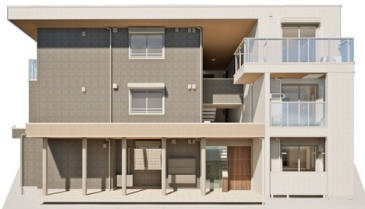
※完成予想図につき、実物とは多少異なる場合があります。